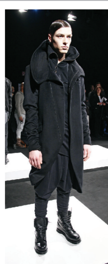
Asymmetrische Schnitte und gute Passformen machen den individuellen Look aus.

Wir mögen Berlin. Es war eigentlich unser erster "richtiger" Besuch in Berlin und wir würden gerne wieder kommen. Wir merken das in Berlin viel passiert. Die Berlin Fashion Week war auch eine schöne Erfahrung für uns, und alles war sehr gut organisiert.